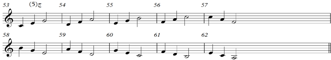
شكل رقم (٦) التدريب الخامس

من م(٥٣) : م(٦٢) كما هو موضح في الشكل الآتي رقم (٦) :