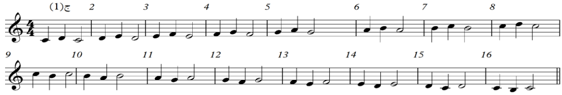
شكل رقم (٢) التدريب الأول

من مازورة (١) : مازورة (١٦) كما هو موضح في الشكل الآتي رقم (٢) :