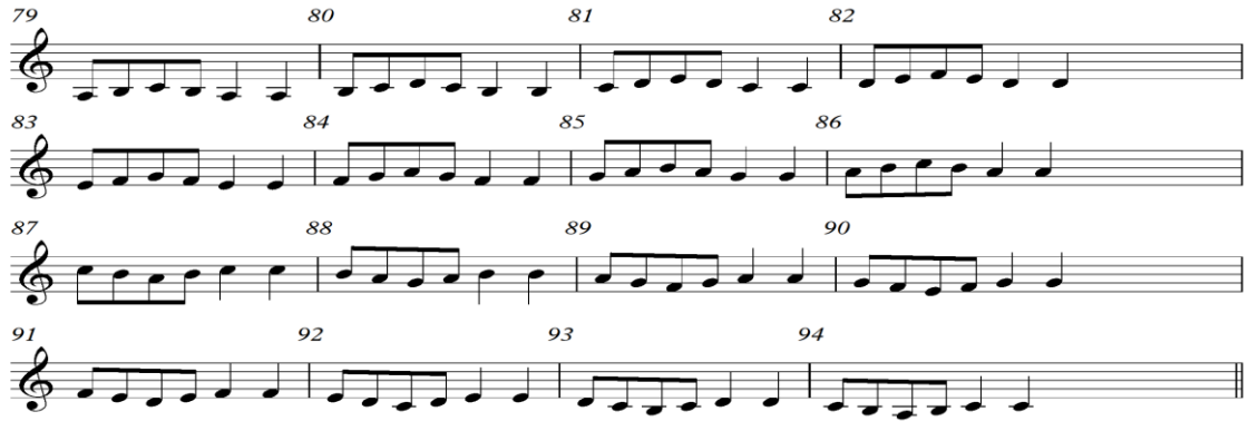
شكل رقم (٨) التدريب السابع