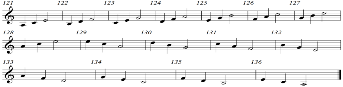
شكل رقم (١١) التدريب العاشر

من م(١٢١) : م(١٣٦) كما هو موضح في الشكل الآتي رقم (١١) :