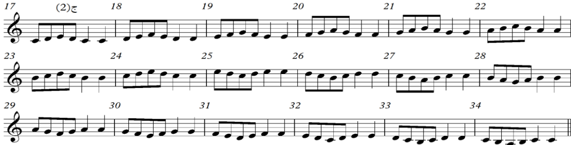
شكل رقم (٣) التدريب الثاني

من م (١٧) : م (٣٤) كما هو موضح في الشكل الآتي رقم (٣) :