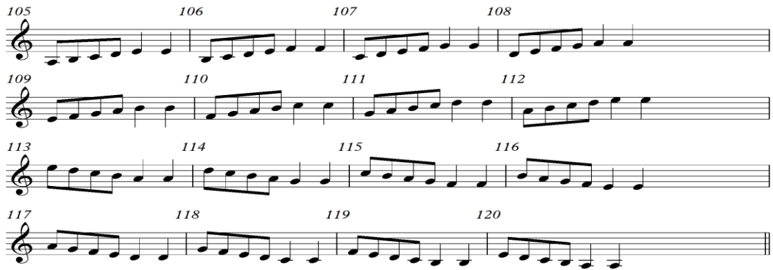
شكل رقم (١٠) التدريب التاسع

بعد الانتهاء من غناء الطلاب للتدريب الثامن تم إعادة غناء من التدريب الأول إلى التدريب الثامن بشكل متصل من م(١) إلى م(١٠٤) من التدريبات المبتكرة شكل رقم (١) التدريب التاسع: من م(١٠٥) : م(١٢٠) كما هو موضح في الشكل الآتي رقم (١٠) :