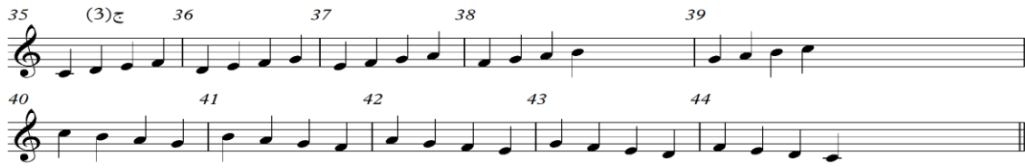
شكل رقم (٤) التدريب الثالث

من م(٣٥) : م(٤٤) كما هو موضح في الشكل الآتي رقم (٤) :